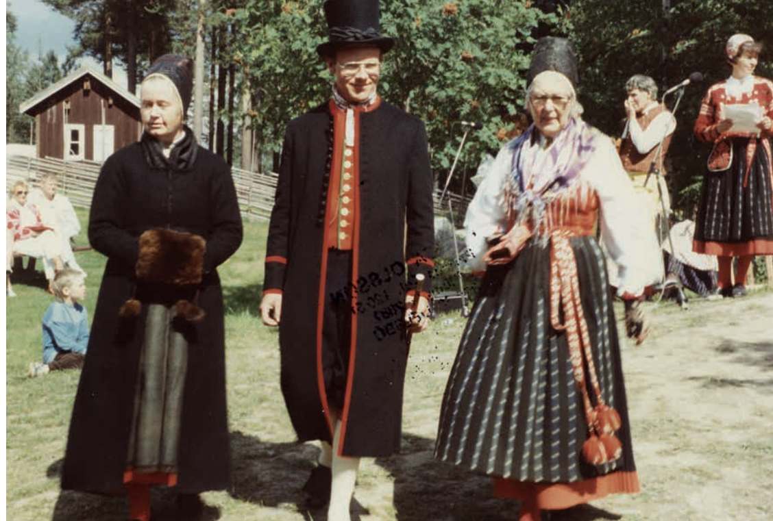
Bild 4: Man i långrock Delsbo. Foto från dräktparad forngården 1988.

vilket inte passade kyrkan som vill ha underdåniga medlemmar. En annan syn på giftermålet, som förstärker denna tolkning, var hur länge bröllopsfirandet skulle pågå. I Hälsingland varade det i en vecka trots att man endast fick fira i tre dagar. Att det var svårt att bryta seden visar källorna. Redan vid ett riksting den 14 juni 1623 beslutades att: