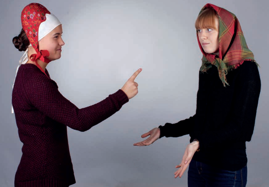
Bild 2: Till vänster kvinna med finka, lokal variant från Forsa, Hälsingland. Till höger kvinna med "näsduk"/huvudkläde, Ljusdalsmodell. Foto: Margareta Danhard 2015. 31